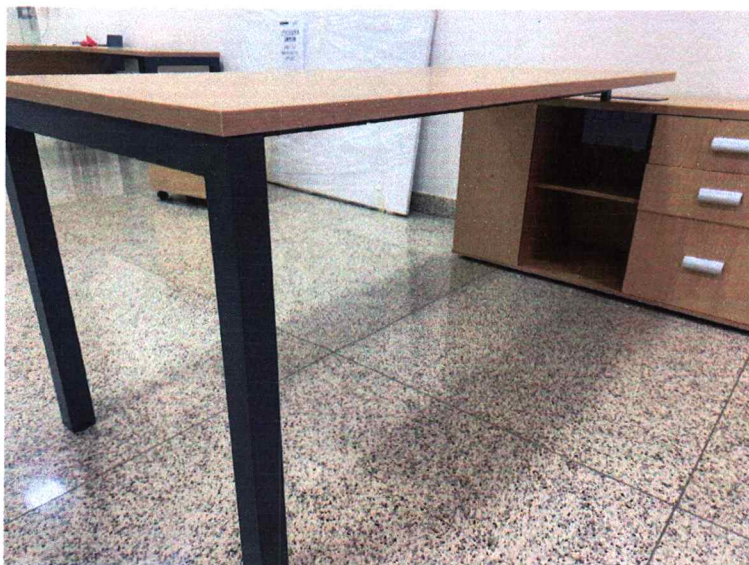
Fig. 2 - Tampo reto e com cantos vivo. Edital pede tampo chanfrado e com cantos arredondados