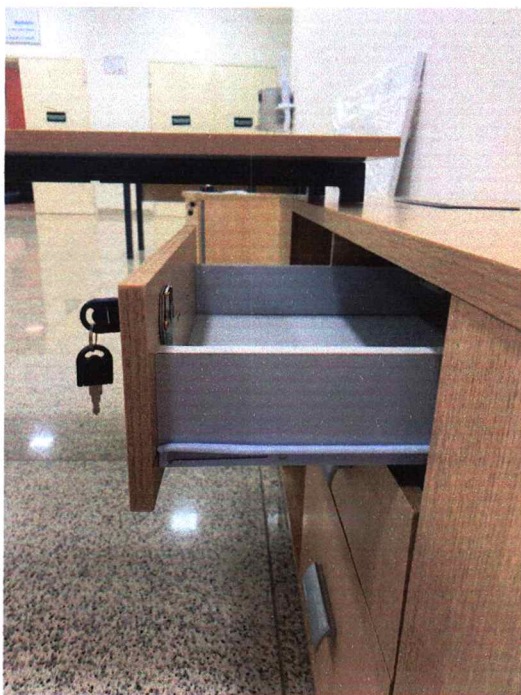
Fig. 8 - Frente de gaveta em 15mm. Edital pede no mínimo 18mm