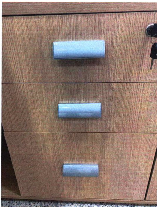
Fig. 6 - Puxador plástico. Edital pede alumínio