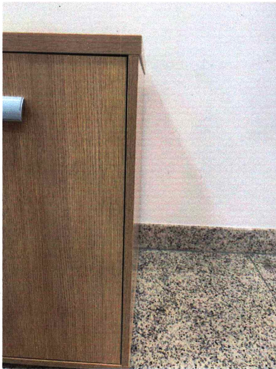
Fig. 7 - Laterais em 15mm. Edital pede no mínimo 18mm

Relatório de Amostras - Pregão Presencial 007/2022 - pág. 4