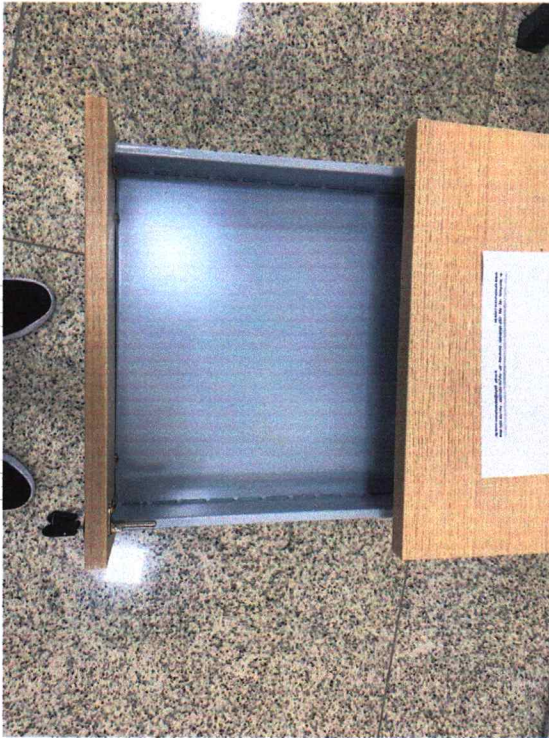
Fig. 13 - Gaveta não possui porta objetos

Relatório de Amostras - Pregão Presencial 007/2022 - pág. 7