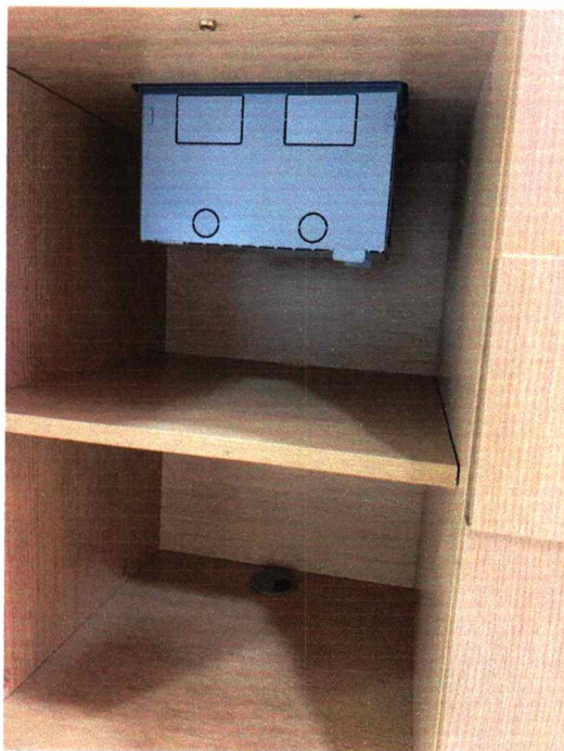
Fig. 4 - Não possui calha para subida de fiação