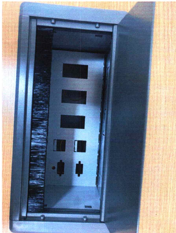
Fig. 5 - Apenas 3 furos para elétrica. Edital exige 4

Relatório de Amostras - Pregão Presencial 007/2022 – pág. 3