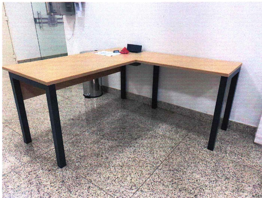
Fig. 9 - Mesa com medida de 1500x1600. Edital pede 1400x1500

Relatório de Amostras - Pregão Presencial 007/2022 - pág. 5