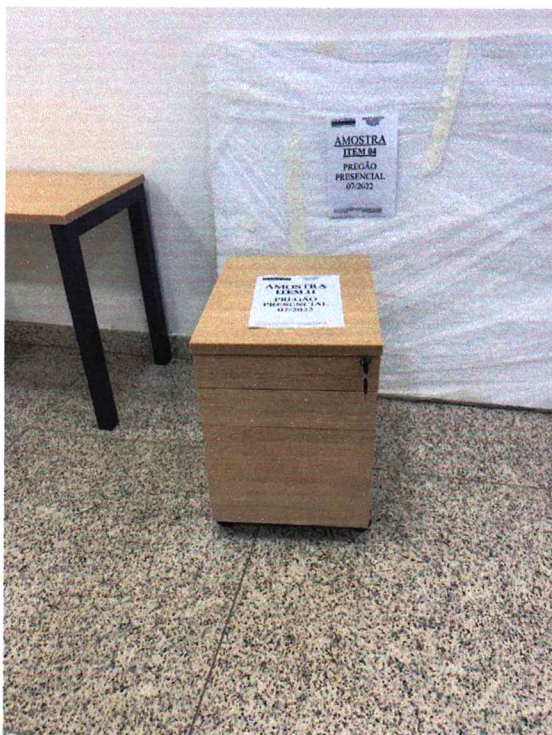
Fig. 12 - Gaveteiro com medida de 400x520. Edital pede 330x520