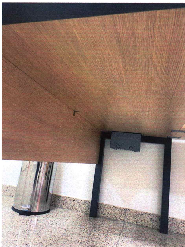
Fig. 10 - Não possui travessa