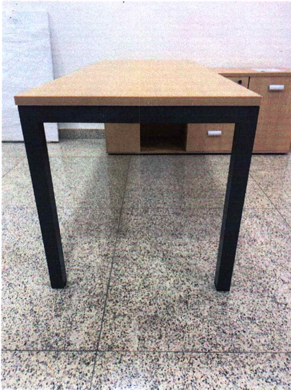
Fig. 1 - Pés formato trave e não X como fala o edital. Medida dos pés é 50x50mm e edital pede 60x30mm