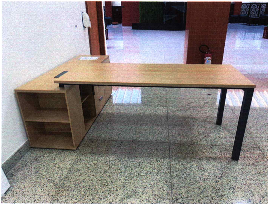
Fig. 3 - Não possui painel frontal. Edital pede painel frontal de no mínimo 1000x200

Relatório de Amostras - Pregão Presencial 007/2022 - pág. 2