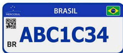
Figura 2. Modelo Emplacamento Padrão Mercosul Oficial