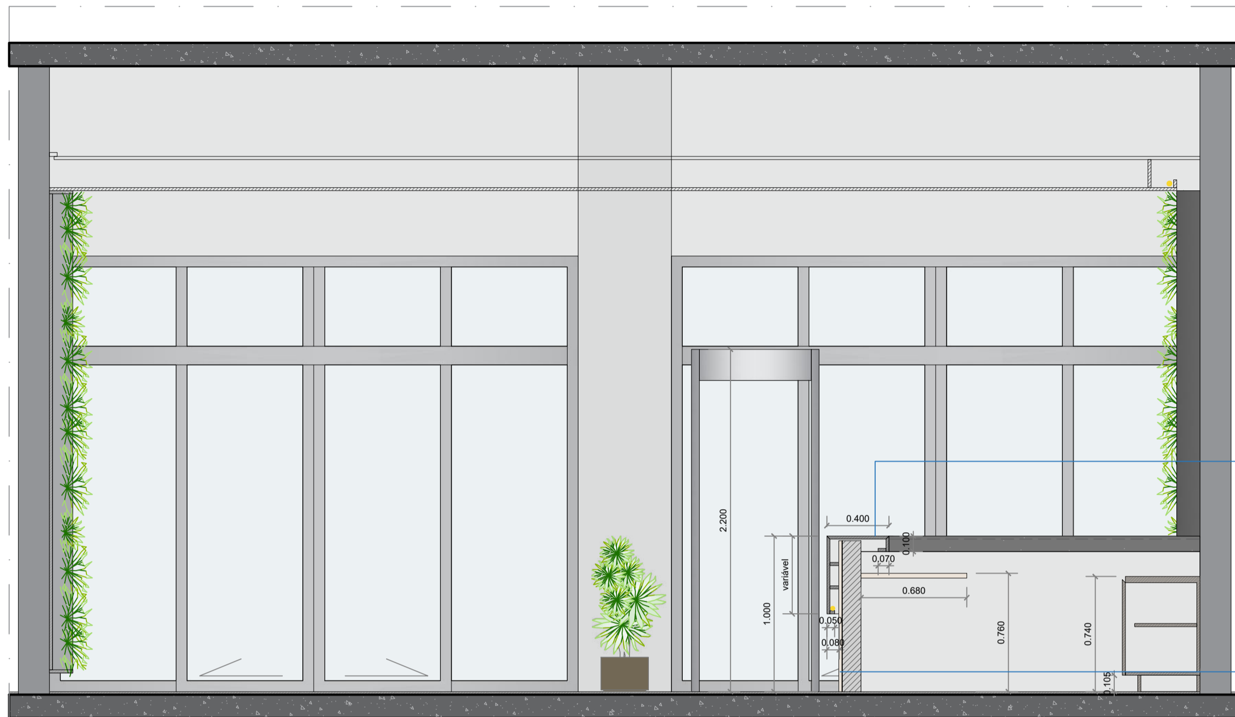
Vista 03 - RECEPÇÃO escala: 1:25

BALCÃO EM GRANITO PRETO ABSOLUTO OU PRETO SÃO GABRIEL, COLADO EM MEIA ESQUADRIA PREVER ILUMINAÇÃO OCULTA