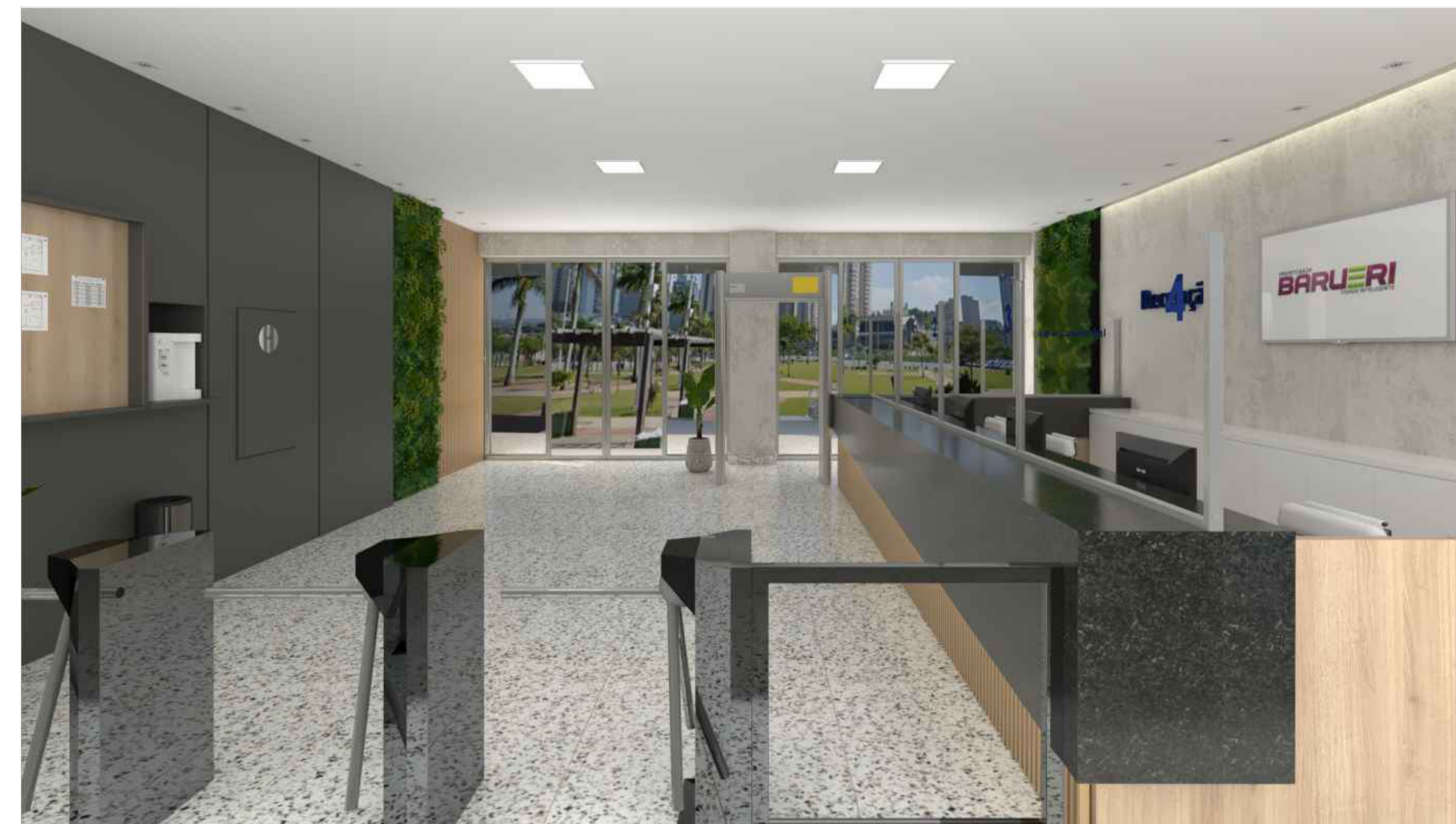
IMAGEM PERSPECTIVA PARA REFERÊNCIA