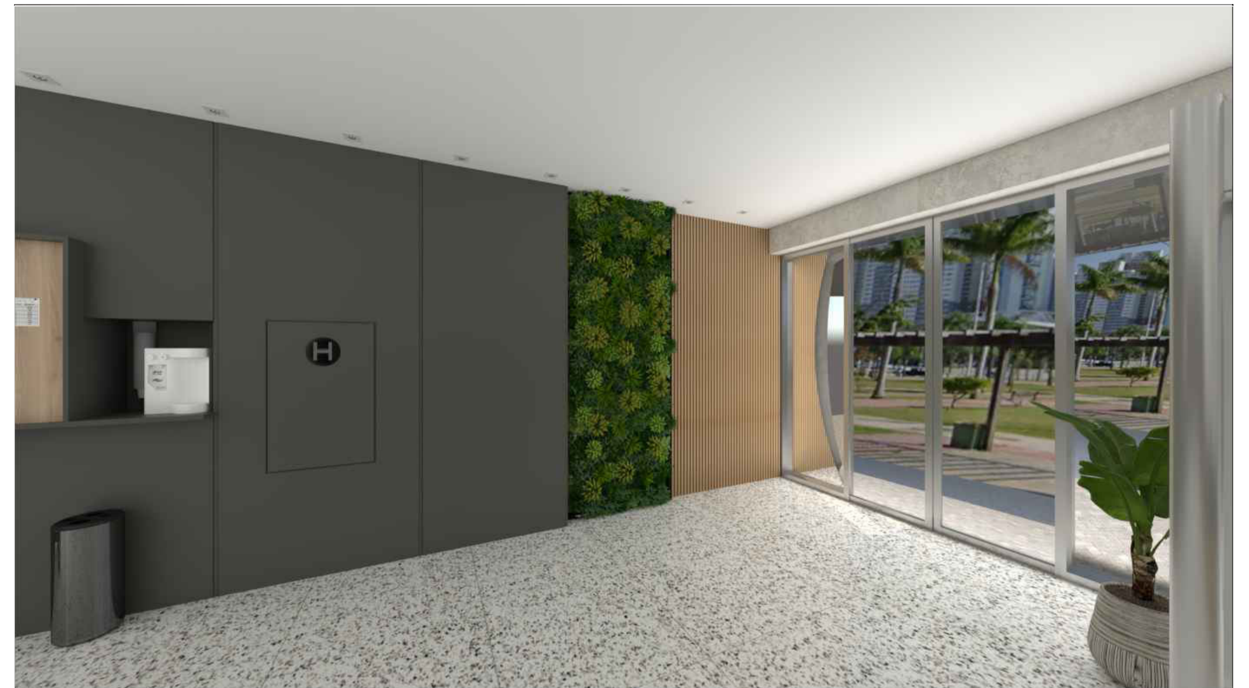
IMAGEM PERSPECTIVA PARA REFERÊNCIA

PAINEL RIPADO EM MDF DURATEX CARVALHO HANOVER